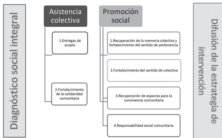
Fig. 1 Methodological structure of the COSS strategy

As mentioned before, the intervention with children is framed within this general strategy and, although there was an approach with this population during the first stage, the group work was developed in the second stage, that of social, whose location is shown in Box 2 in the following image (Figure 1).